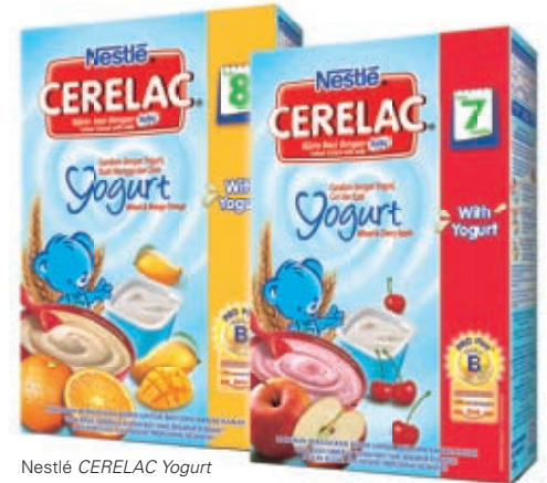
Nestlé CERELAC Yogurt

Teguh kepada janjinya untuk memupuk generasi yang sihat, perniagaan Ibu & Pemakanan Bayi memperkenalkan laman web baru - www.startwellstaywell.com.my - untuk para ibu mempelajari dengan lebih lanjut mengenai pemakanan 1,500 hari pertama dalam kehidupan anak mereka.