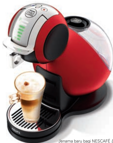
Jenama baru bagi NESCAFÉ Dolce Gusto iaitu Caramel Latte Macchiato

Tema perayaan, '75 tahun bersama kopi hebat dan seterusnya' mencerminkan legasi jenama ini dalam sejarah kopi di seluruh dunia dan juga janjinya untuk terus memberikan rasa kopi yang terbaik dan berkualiti kepada para pengguna.