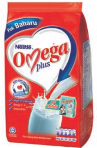
NESTLÉ OMEGA PLUS

Bersama-sama dengan HFM, NESTLÉ OMEGA PLUS juga menganjurkan beberapa aktiviti-aktiviti kesihatan yang berkaitan seperti ' Walk A Mile ' dan Tayangan Kesihatan Jantung, sempena Hari Jantung Sedunia pada 29 September 2013. Acara ' Walk A Mile ' turut dihadiri oleh Tun Dr. Mahathir Mohamad dan Tun Dr. Siti Hasmah Mohamad Ali.