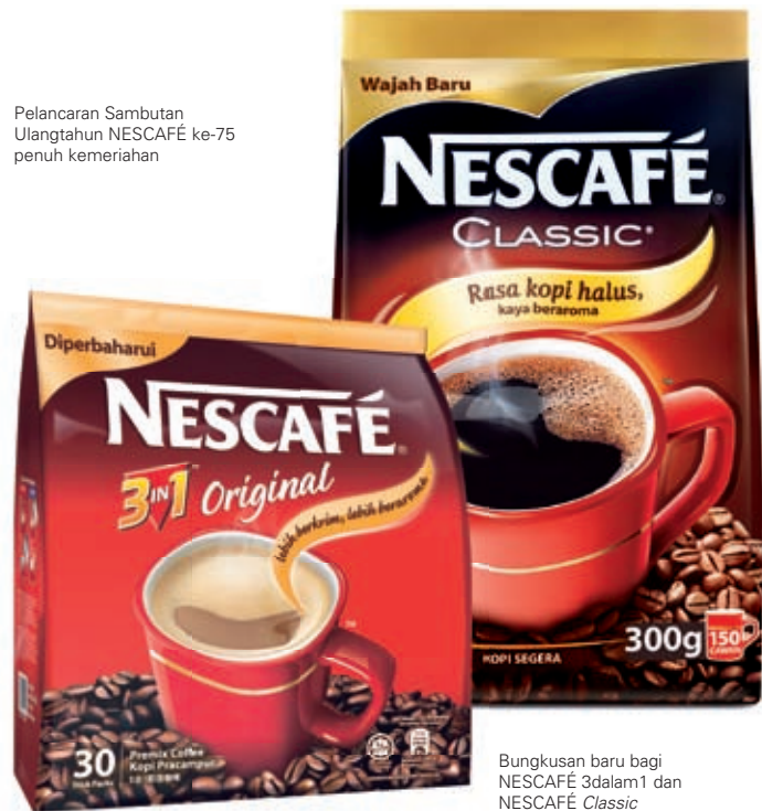
Bungkusan baru bagi NESCAFÉ 3dalam1 dan NESCAFÉ Classic

Pelancaran Sambutan Ulangtahun NESCAFÉ ke-75 penuh kemeriahan