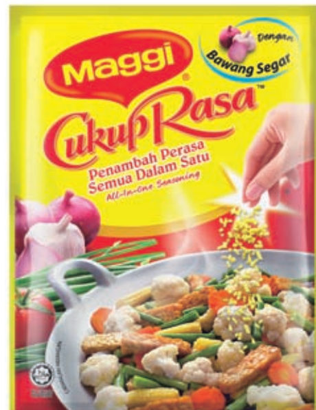
MAGGI Cukup Rasa

MAGGI Cukup Rasa, perasa semua-dalam-satu yang terkemuka, telah menunjukkan pertumbuhan yang luarbiasa dan peningkatannya dalam pasaran, berikutan sokongan media yang lebih baik dan pelancaran pek 25g, yang meningkatkan ketersediaan di kedai-kedai top-up .