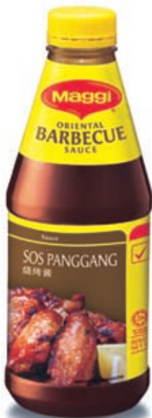
MAGGI Sos Oriental Barbeku

Nestlé Professional telah bekerjasama dengan Persatuan Chef Malaysia, untuk menghasilkan sebuah buku resipi berjudul Amazing Inspirations , yang mengetengahkan kemahiran memasak dan resipi kreatif chef-chef terbaik negara yang menggunakan MAGGI, untuk memberi inspirasi kepada chef-chef muda dalam industri.