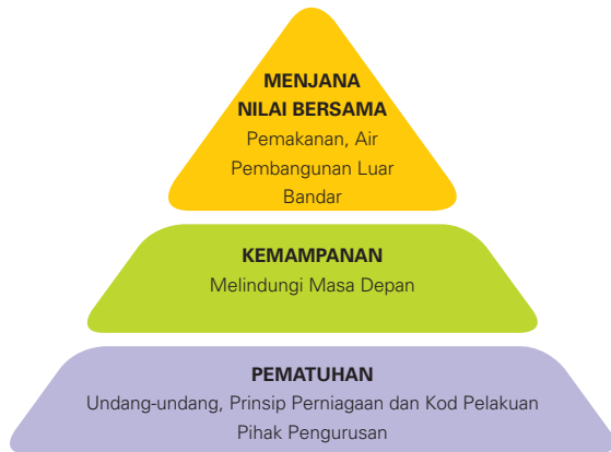
Piramid Nestlé dalam Masyarakat

Menjana Nilai Bersama (CSV) adalah pendekatan Tanggungjawab Sosial Korporat kami yang dibina atas landasan bahawa untuk perniagaan terus maju bagi jangka masa panjang, kami perlu mengambilkira keperluan komuniti di mana kami beroperasi dan pemegang saham kami. Ia adalah asas cara kami mengendalikan perniagaan dan dasar kepada budaya dan nilai kami, di samping merupakan prinsip motivasi warga kerja kami. Hubungannya terhadap inisiatif korporat, produk dan jenama kami menggesa kami untuk menerapkan strategi ini ke seluruh rangkaian nilai dan operasi perniagaan.