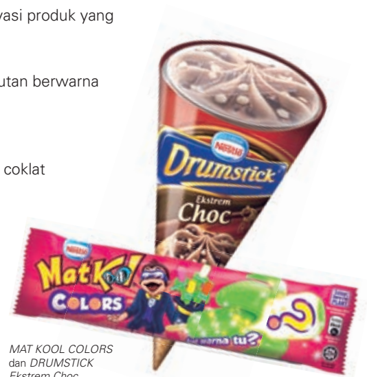
MAT KOOL COLORS dan DRUMSTICK Ekstrem Choc

Produk hebat baru yang ditumpukan secara strategik kepada pasaran sasaran tertentu seperti pencinta coklat telah meningkatkan pertumbuhan perniagaan Ais Krim.