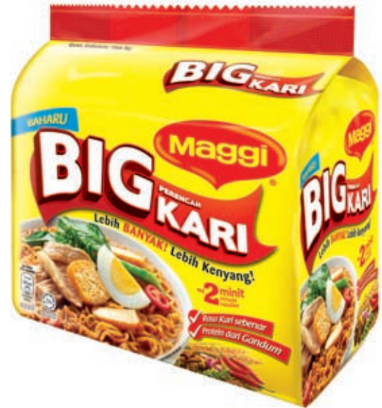
MAGGI Big Kari

MAGGI menggunakan sentimen para pengguna yang positif terhadap produk masakannya melalui program afiniti yang mempromosikan kebaikan memasak di rumah di kalangan belia. Dalam pertandingan memasak sekolah menengah, yang sekarang masuk tahun ke-17, pelajar dari 16 negeri telah menyediakan hidangan istimewa buatan sendiri dan mengambil bahagian dalam bengkel masakan dan pemakanan.