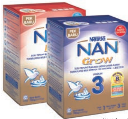
NAN Grow 3

Unit perniagaan ini juga memperkenalkan pembungkusan baru yang menarik untuk NAN Grow 3 dan NAN Kid 4. Produk-produk hebat ini menyediakan 100 juta probiotik BIFIDUS BL setiap hari untuk meningkatkan bilangan bakteria baik dalam kanak-kanak, dan seterusnya menyokong sistem imun mereka.