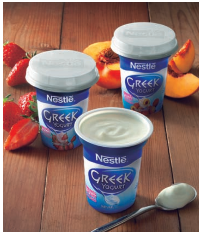
Nestlé Greek Yogurt

Perniagaan Tenusu Sejuk mengekalkan momentum pertumbuhannya yang kukuh tahun ini melalui kempen pemasaran yang berjaya dan rangkaian produk baru yang amat lazat dan sihat.