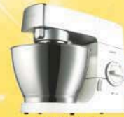
Kenwood Mixer x 10