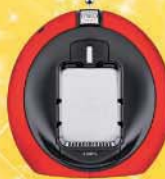
Pembancuh Kopi Krups Dolce Gusto berserta 25 set Kapsul Dolce Gusto x 10