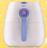
Penggoreng Elektrik Philips 'Airfryer' x 10