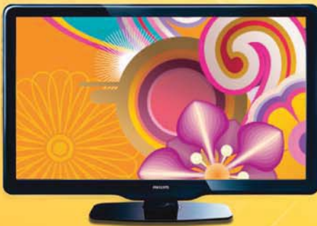
TV LCD 42" Philips x 10