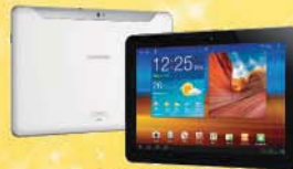
Samsung Galaxy Tab x 10