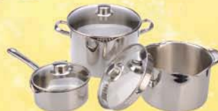
Set Masakan La Gourmet x 10