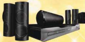
Set Sistem Teater Rumah Blu-ray Philips x 10

Menangi 100 Hadiah Bonanza pilihan anda sempena sambutan tahun NESTLÉ!