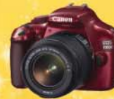
Kamera Digital Canon DSLR x 10