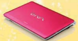
Komputer Riba Sony Vaio x 10